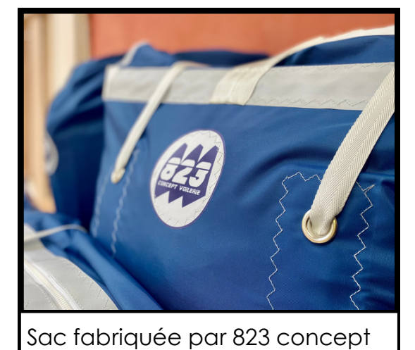
Sac fabriquée par 823 concept