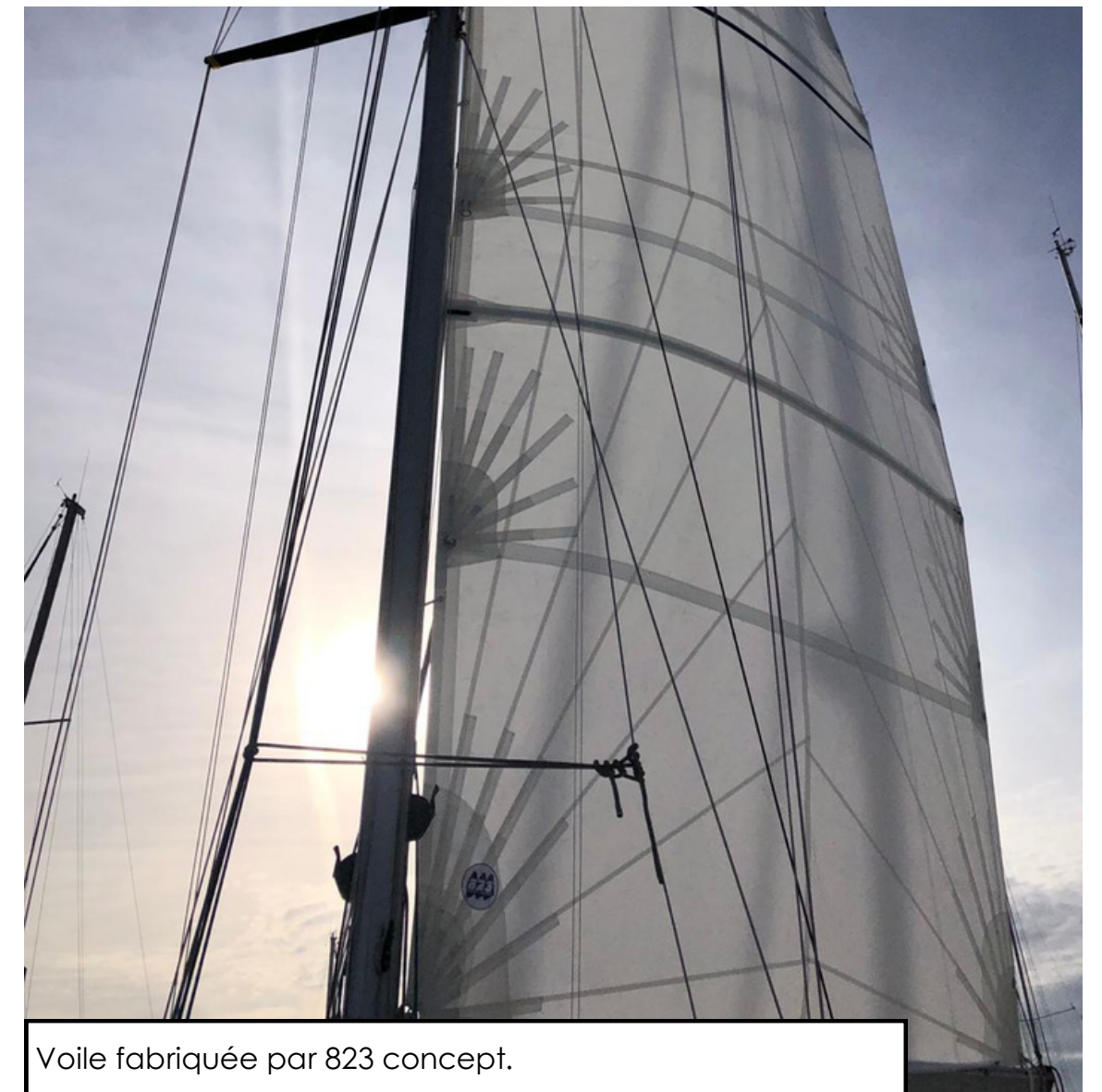
Voile fabriquée par 823 concept.

Mais encore, 823 CONCEPT est une voilerie engagée , collaborant étroitement avec Remise à Flots. Remise à Flots est une association qui fabrique des objets tels que des sacs, des portefeuilles, des porte-clés, en réutilisant des matériaux tels que les chutes de tissus. De plus, cette association à vocation écologique s'investit également sur le plan social , puisque tous les salariés sont des personnes en réinsertion professionnelle.