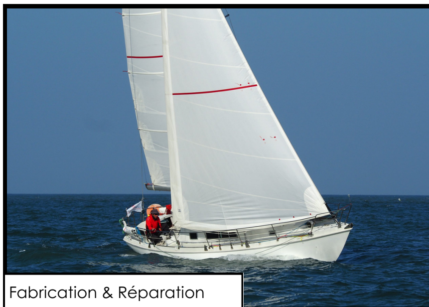
Fabrication & Réparation