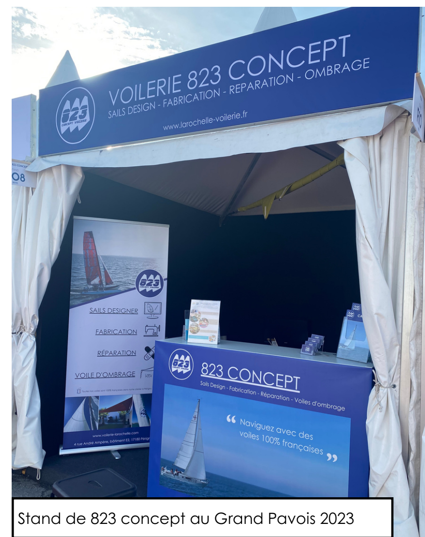
Stand de 823 concept au Grand Pavois 2023

Le First et l'essai des voiles, permettent d' assurer la qualité des dernières créations de l'entreprise.