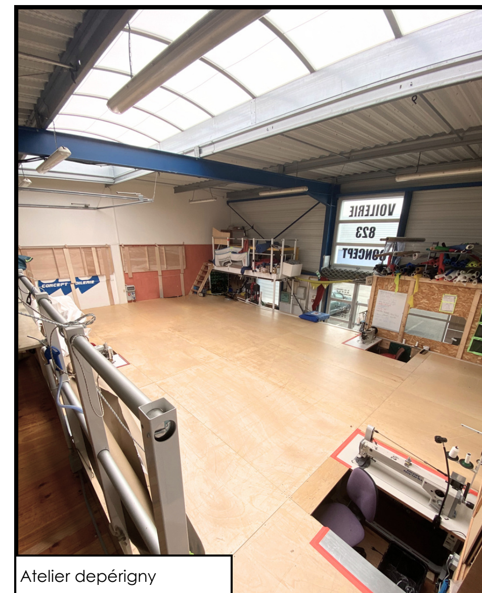
Atelier de périgny