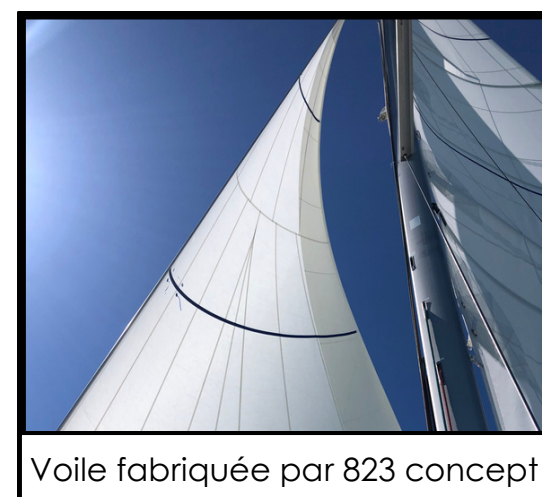
Voile fabriquée par 823 concept