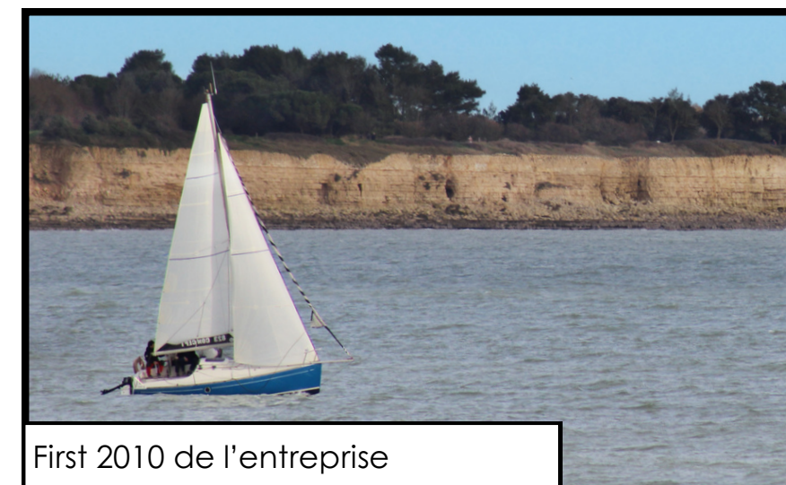
First 210 de l'entreprise